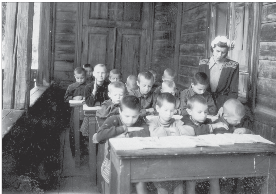
Воспитанники Детского дома г. Сызрани на занятиях