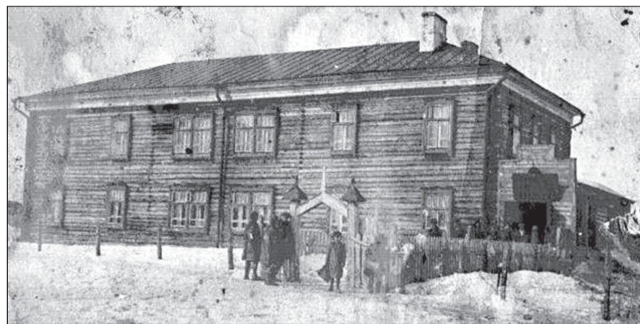
Тимашевская школа. 1941 год.